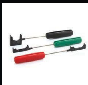
Manches type brosse à dents

Nos accessoires sont les compléments parfaits du système RVG 5200 et permettent d'optimiser le traitement des images. Les capteurs sont fournis avec un kit d'échantillons d'enveloppes hygiéniques jetables, des positionneurs et des supports de montage.